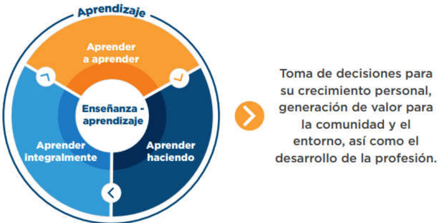
Figura 1. Relación de los elementos pedagógicos con el proceso de enseñanza y aprendizaje. Fuente Acuerdo Superior 269 de 2020.